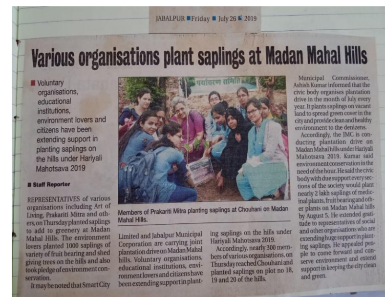
Limited and Jabalpur Municipal Corporation are carrying joint plantation drive on Madan Mahal hills. Voluntary organisations, educational institutions, environment lovers and citizens have been extending support in planting saplings on the hills under Hariyali Mahotsava 2019. Accordingly, nearly 300 members of various organisations on Thursday reached Chouhani and planted saplings on plot no 18, 19 and 20 of the hills.