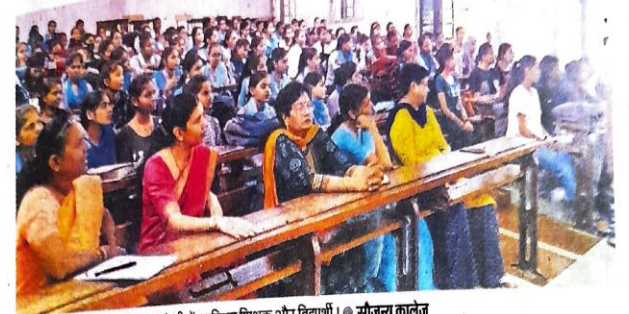
होमसाइंस कॉलेज में आयोजित संगोष्ठी में उपस्थित शिक्षक और विद्यार्थी।