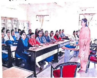
होमसाइंस कालेज में विभिन्न आयोजन पर उपस्थित छात्राएं व शिक्षिकाएं। सी. आयोजक होमसाइंस कालेज में मंगलवार को बीएससी प्रथम वर्ष की छात्राओं को व्यक्तिगत विकास टुट्ट पथ वचन की जानकारी दी गई। स्नातकोत्तर