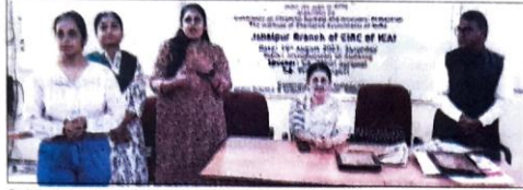
Subject experts seen during Financial and Tax Literacy programme at Home Science College.